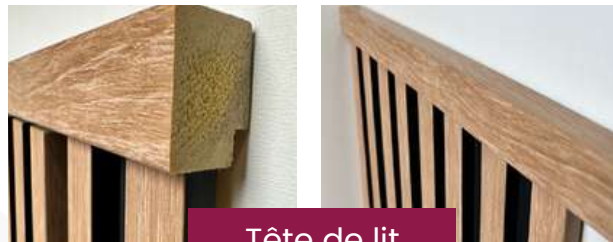
Tête de lit

En la retournant de sorte que l'épaisseur de la baguette couvre les coupes (voir photos) - (Idéalement retoucher la tranche de la baguette avec une touche de peinture noire). Habiller ensuite de part et d'autre de la tête de lit d'une finition gauche et d'une finition droite.