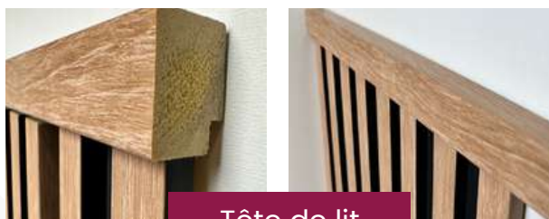
Tête de lit

En la retournant de sorte que l'épaisseur de la baguette couvre les coupes (voir photos) - (Idéalement retoucher la tranche de la baguette avec une touche de peinture noire). Habiller ensuite de part et d'autre de la tête de lit d'une finition gauche et d'une finition droite.