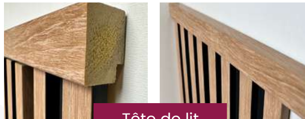
Tête de lit

En la retournant de sorte que l'épaisseur de la baguette couvre les coupes (voir photos) - (Idéalement retoucher la tranche de la baguette avec une touche de peinture noire). Habiller ensuite de part et d'autre de la tête de lit d'une finition gauche et d'une finition droite.