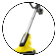
PCL4 ou équivalent

Pour les bordures et les terrasses de plus petite taille, un modèle plus basique de type Kärcher PCL4, ou équivalent, est suffisant.