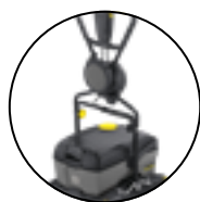
40/10 C ou équivalent

Un second lavage à l'automne / en fin de saison est parfois recommandé afin de limiter l'encrassement et faciliter le nettoyage de printemps.